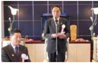
来賓挨拶を行う石川由利本荘市副市長