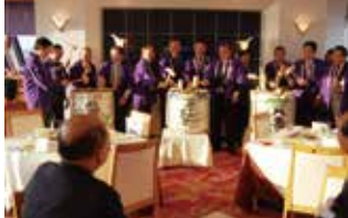
交流懇親会での鏡割り