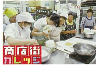
北秋田市「商店街カレッジ」事業

地域の「総合経済団体」として、また中小企業の支援団体として、豊かな地域づくりと商工業振興のために、意見活動、まちづくり活動、社会一般の福祉の増進など、幅広い活動を行っています。