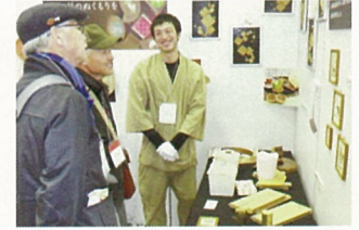
物産展・商談会への出展