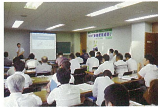
事業承継のための後継者育成塾