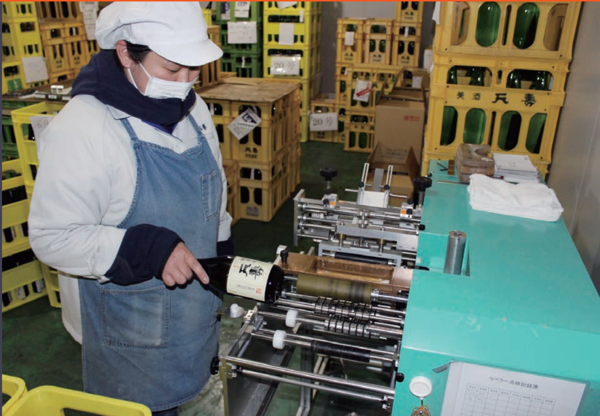
冷蔵庫内で作業できる可動式ラベル貼り機を導入し品質向上と生産性向上を遂げた「天寿酒造株式会社」

新型コロナの感染拡大や少子高齢化等の影響により、今後も事業者を取り巻く経営環境は急激に変化していくことが予想されます。