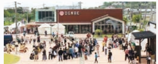
駅前広場を活用したイベントの開催

また、多様化する旅行ニーズに合わせ、洋上風力等の次世代エネルギーに関する教育研修など、新たな観光コンテンツを調査研究します。