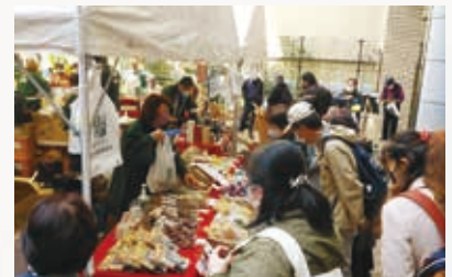
首都圏での物産展開催(山の楽市)

田沢湖や武家屋敷、温泉など豊富な観光資源や、紙風船上げや角館のお祭りなど四季折々に多くの観光客を迎え入れる県内屈指の観光地であるため、多様なニーズに対応可能な受入環境の整備を図ります。また、地場産品を活用した「食」による誘客などを行い、観光交流人口の拡大を目指します。