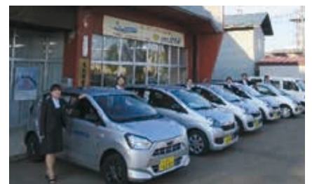
支所統廃合により機動力が上がった北秋田市商工会