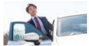
個社支援のため巡回する職員

求められる職員像として「プロ集団として事業者の役に立ちたいという情熱を持ち、自ら考えて何をすべきかを的確に把握し、仲間と協働して難しい課題にも果敢に挑戦する」を掲げ、その実現を促すため人事評価制度を見直しました。また、実践型の研修及び専門資格の取得支援を行った結果、職員の意識は大きく変わり、個社支援における経営課題解決力の強化に結びつきました。