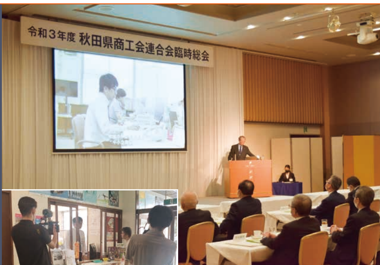
令和4年3月23日開催の臨時総会でプランの成果を報告

県内 21 商工会と県連合会が一体となって取り組む活動計画として、全国初の試みとなった「商工会創生プラン」は、令和 4 年 3 月をもって推進期間を終了しました。