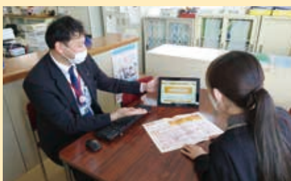
給付金申請のサポートをする指導員