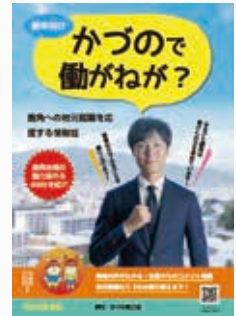
情報誌 「かづので働がねが?」

地域資源を活用した産業の育成を目的に地域資源の調査を行い、鹿角市と小坂町の双方に共通する地域課題解決に取り組みます。また、関係団体と協議し産業振興や地域活性化の提言を行います。